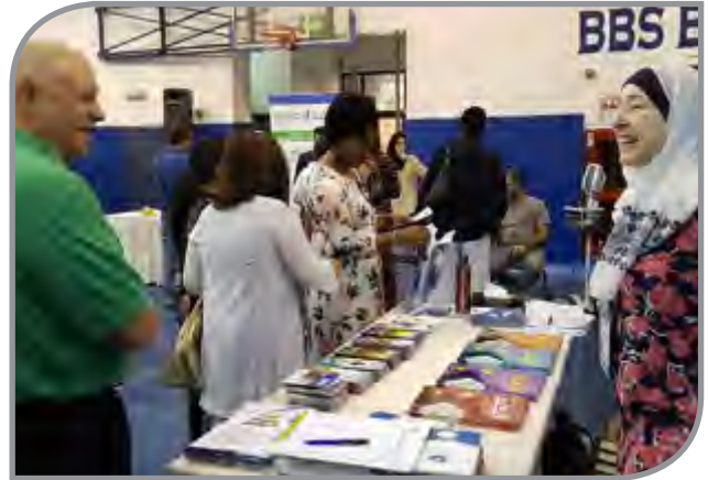
المشاركة في المعارض