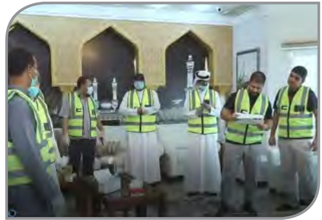
الفريق التطوعي لفزعة الكويت