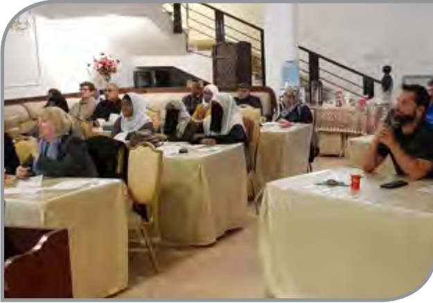
دروس قصص الأنبياء