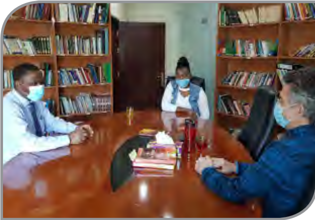
لقاء تعريفى بالإسلام