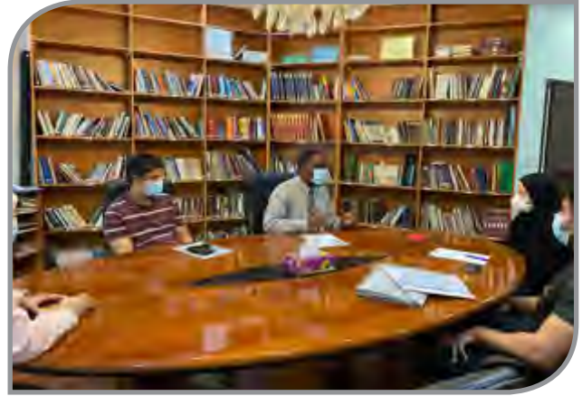
لقاءات تعريفية بالإسلام