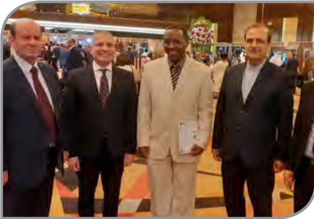
المشاركة في المؤتمرات