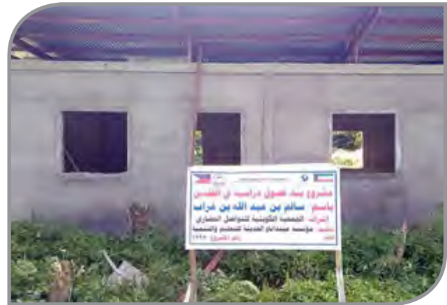
فصول دراسية تحت التنفيذ