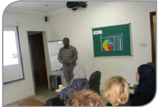
دروس فقه الطهارة والصلاة